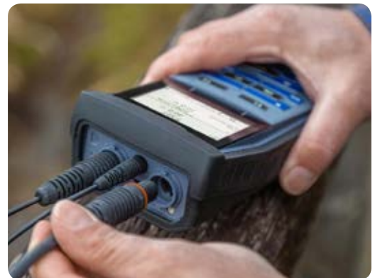
Interface USB étanche pour un transfert rapide des données

Prise étanche pour mesure sur le terrain