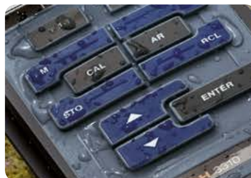
Clavier en silicone monobloc robuste 100% étanche