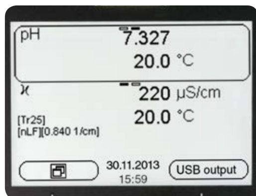
Affichage avec deux valeurs mesurées