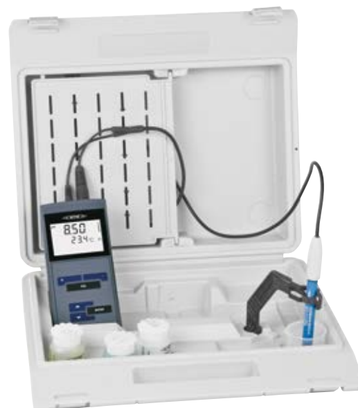
Set en mallette

Pour de plus amples informations, veuillez commander gratuitement notre catalogue “Laboratoire et Terrain Instrumentation” ou visiter notre internet: www.wtw.de/fr/produits/laboratoire (Pour plus de facilité vous pouvez aussi utiliser le QR code).